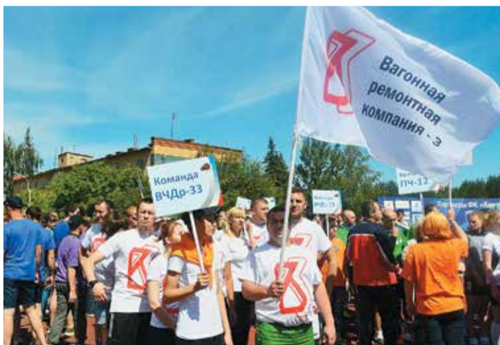
К победам под вдохновляющим и мобилизующим флагом АО «ВРК-3» стремились мужчины команды вагонного ремонтного депо Калуга, которых вдохновляли милые семейные болельщики всех возрастов

На стадионе «Анненки» города Калуги в июне прошли игры 1-го узлового уровня «Спорт поколений – 2018» Московско-Смоленского региона Московской железной дороги