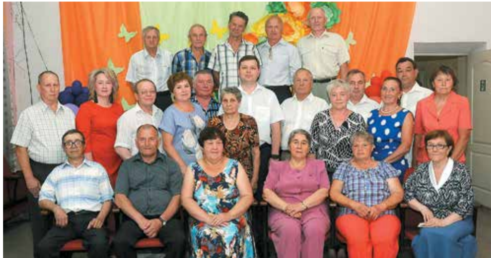
Ветераны-пенсионеры депо Верещагино в центре внимания юбилейного торжества

В июле 85-летие своей деятельности отпраздновало вагонное ремонтное депо Верещагино АО «ВРК-3»