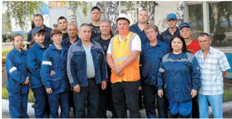
Передовой коллектив ремонтно-заготовительного производственного участка

Один из лидеров 2017 года успешно работает и в нынешнем году. По итогам работы в I квартале коллектив депо Магнитогорск занял 3-е место в соревновании предприятий АО «ВРК-1»